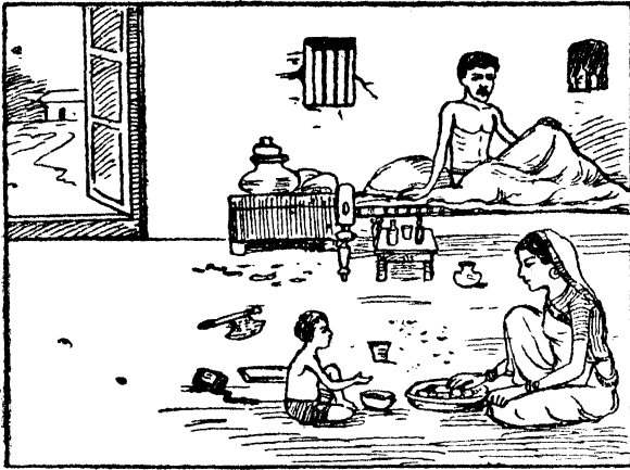
चित्र २—बन्द और गन्दे मकान में रहने वालों का स्वास्थ्य